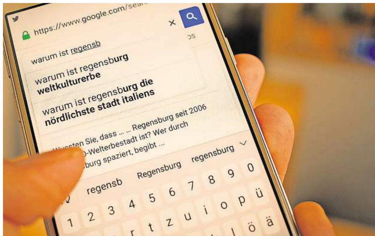
Was die Leute nicht alles suchen? Wir haben Fragen im Internet zu Regensburg gesammelt.

Oft gehörte Argumente dafür, dass Regensburg die nördlichste Stadt Itali-